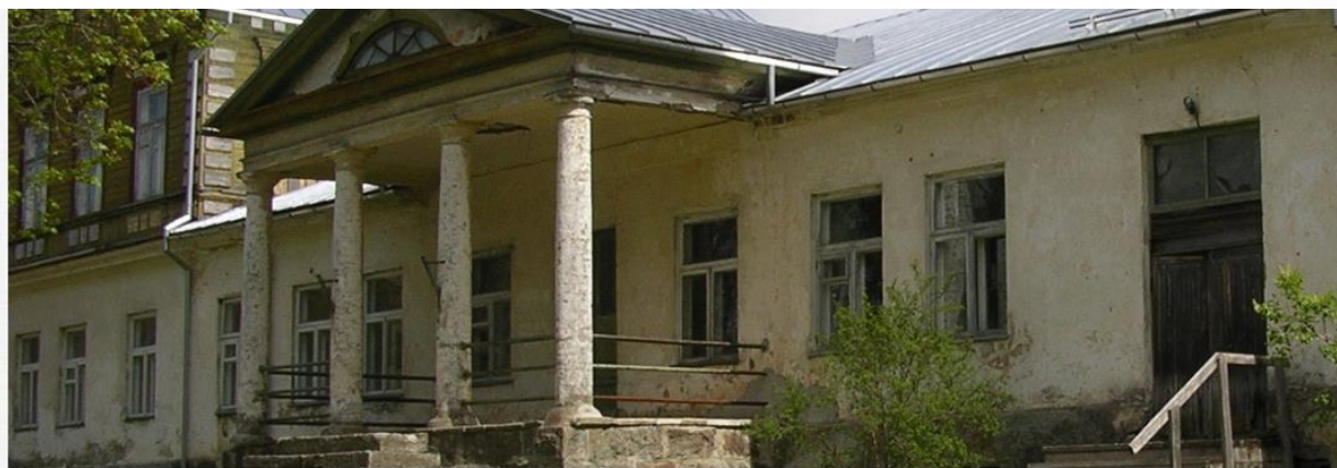
Orina mõis – "Mõisalugu uues kuues"

Sügis 2015 – õpilugu „Mõisa lugu uues kuues“. Kogemused keskkonnaga LearningApps.org. Valmis koduleht Orina mõisast loodud vahvatest äppidest.